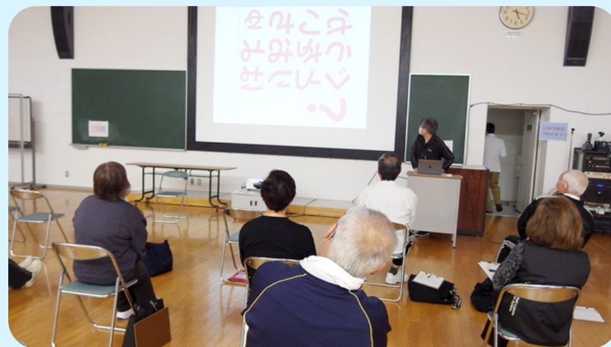
頭をつかった運動 (ゲームみたいで楽しめる)